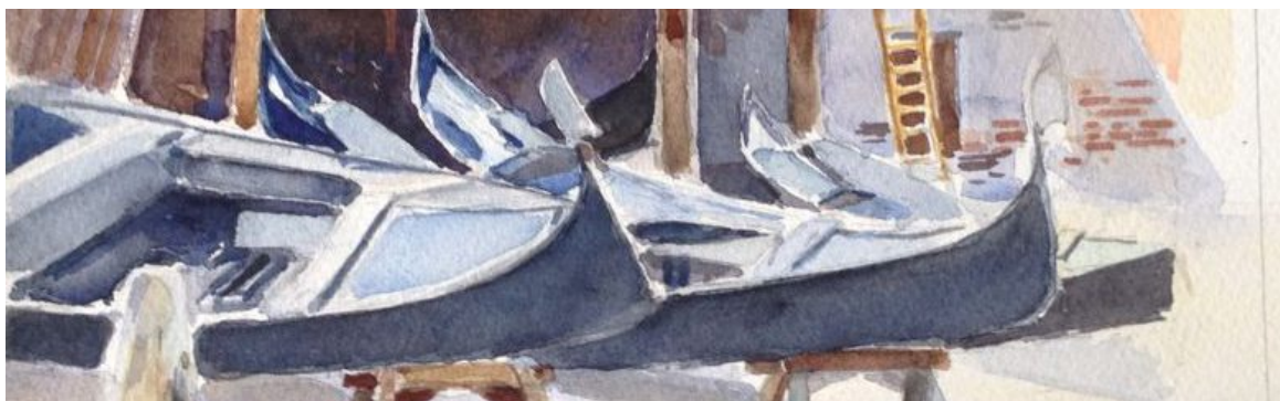
Illustrazione Alessandro Minio