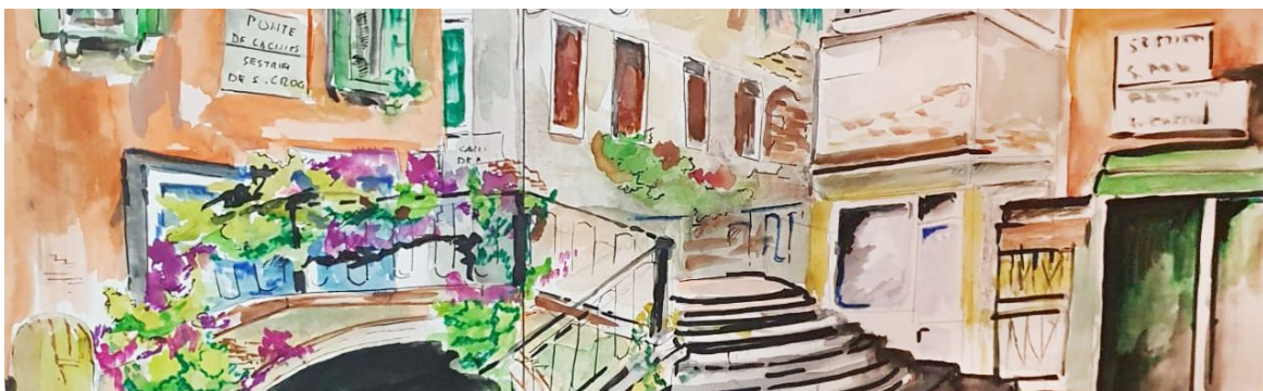
Illustrazione Gianfranco Bruscaignin

Le implicazioni neurologiche dei disturbi del sonno e delle apnee notturne, le malattie cerebrovascolari genetiche, le angiopatie e la vasculopatia Moyamoya saranno altri argomenti di rilievo. Infine si esamineranno le problematiche della disfagia e dell'alimentazione e le attuali tendenze della riabilitazione neurologica nell'ambito cognitivo, cardiovascolare e motorio.